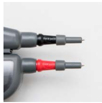
Puntas de las sondas para empujar (limitadores) 4 mm